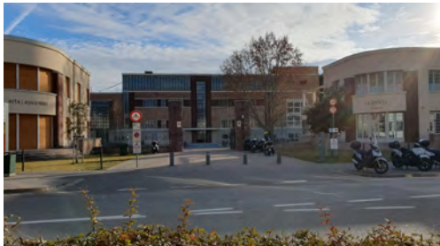
Questo è il NOI Techpark a Bolzano.

L'Assemblea dei soci è stata fatta a Bolzano presso il NOI Techpark.